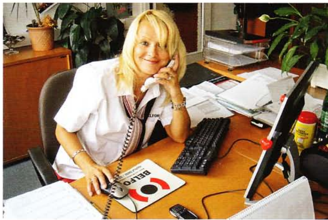
Komfort für Kunden: die Online-Hausverwaltung

nicht nur die Schnittstellen innerhalb eines (auch des eigenen) Unternehmens, sondern vor allem auch die zwischen den verschiedenen Parteien und Dienstleistungspartnern gemeint, z.B. zwischen Eigentümer und Hausverwaltung, Makler und Versicherung, Versicherung und Sanierer etc. Mit dem „preferred partners system“ – und damit auch einer höheren Professionalisierung – setzt die Hausverwaltung darauf, für den Kunden wesentlich größeren Nutzen zu schaffen. Informationen fließen besser, die Dienstleistung wird schneller abgewickelt, Konfliktpotenzial verringert sich. Alle Beteiligten profitieren von klareren Prozessen und einer besseren Dokumentation. Denn damit sparen sie Zeit. Eine effizientere Abwicklung macht die Sache darüber hinaus auch kostengünstiger.